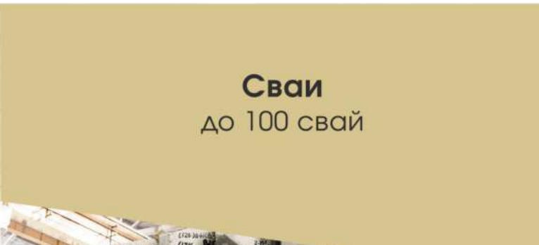
Сваи до 100 свай