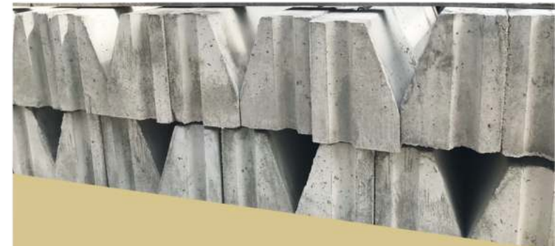
Фундаментные блоки до 200 блоков