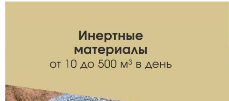
Инертные материалы от 10 до 500 м 3 в день