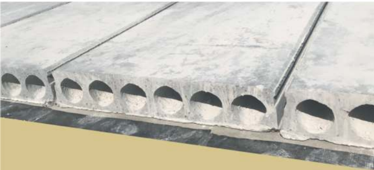
Плиты перекрытий до 240 м.п.