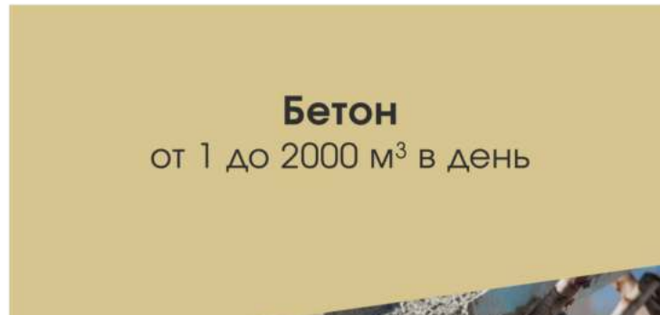
Бетон от 1 до 2000 м 3 в день