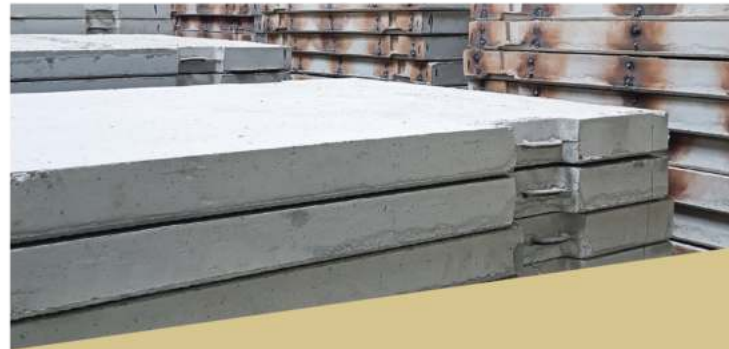
Плиты дорожного покрытия от 1 до 200 плит